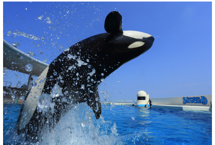
同社が運営する水族館「鴨川シーワールド」

PC 向けに社内ポータルサイトを運営していましたが「Google Apps for Work™」と BYOD が実現したので、業務用 PC を持たないスタッフへの情報共有基盤として既存のコンテンツを「Google サイト」へ移行することを進めています。社内業務に関する便利な情報提供に加えて、各施設で取り組んでいる施策の紹介といったコーポレートアイデンティティを強化するコンテンツも掲載する予定です。