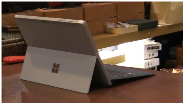
Surface 3 は社員向け教育動画の閲覧にも利用する

以前は本社と各店舗との連絡方法が電話とFAXでしたが、店舗数が600を超えるようになり同じ方法での情報共有が難しくなっていました。「スマートカタログ」を導入したことで、周知の翌日には全店舗に情報を行きわたらせることが徹底できるようになり、導入効果を実感しています。